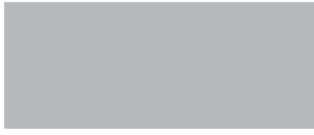
GRIGIO PERLA F190