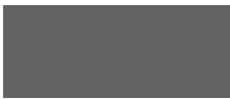
GRIGIO ANTRACITE F254