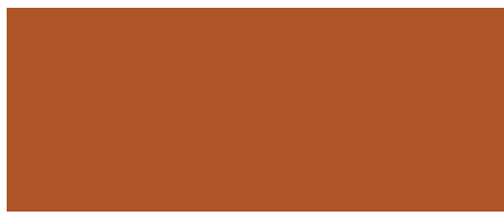
ROSSO RUGGINE F252