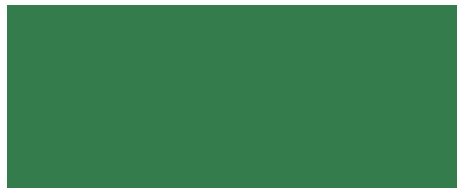
VERDE PALMA F010