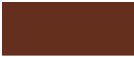
MARRONE CASTAGNA F007