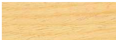
Trasparente U.V. U600

I colori di questa cartella sono da considerarsi indicativi e simulano l'applicazione di una mano di Linfa U60 su abete piallato. Il risultato può variare in funzione del tipo di legno e levigatura. Su richiesta si realizzano tinte personalizzate.