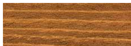
Noce chiaro U607