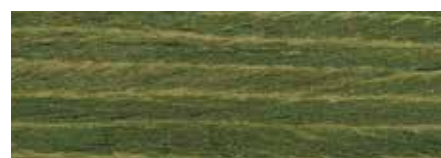
Verde bosco U657