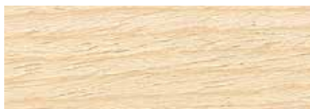
Bianco calce U610