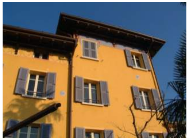
Facciata, Sandro Bolpagni