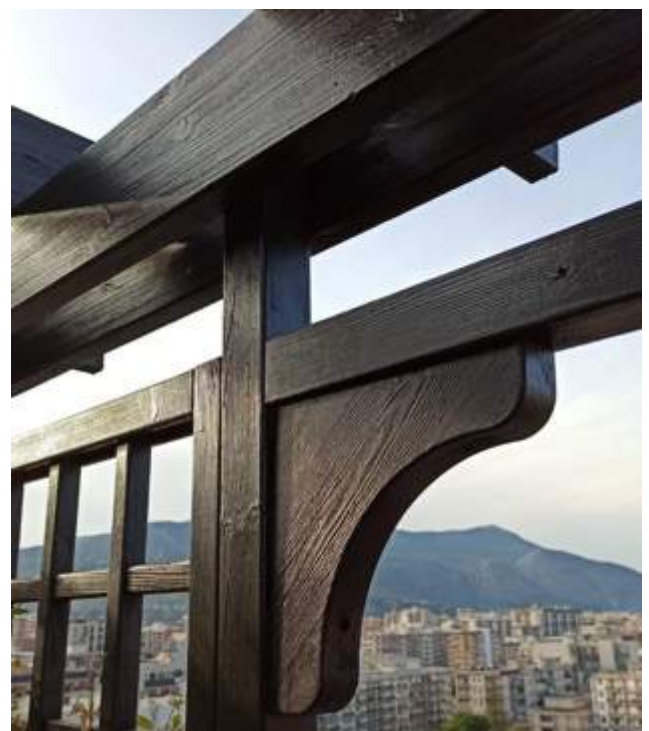
Serramenti in legno, Palermo