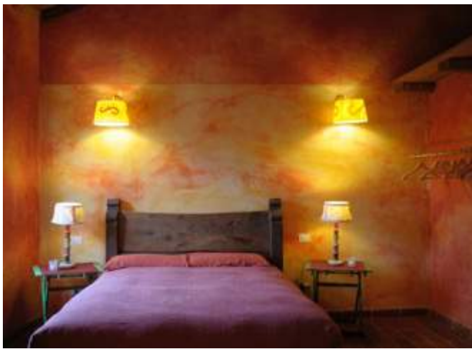
Oasi di biodiversità di Galbusera Bianca