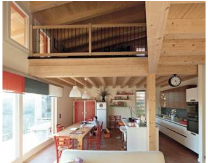
Appartamento progetto, Service Legno