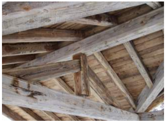
Tetto antichizzato, Duclos