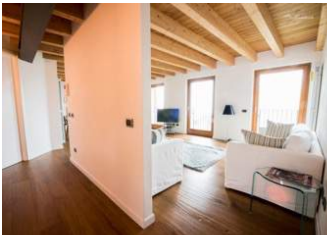
Casa vacanze Valtellina, Bioprogettazione Tarca e Tarca Costruzioni